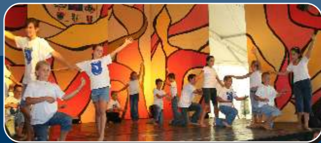
Velencei-tavi Nyári Játékok - Sukorói Csillagcskák