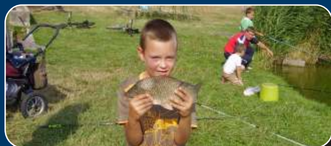
A nagy fogás!