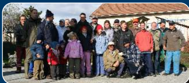
Önkéntesek - az illegális szeméttelrakók felszámolói