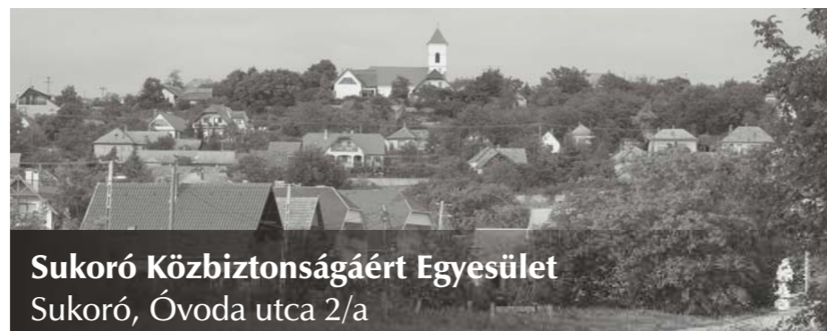
Sukoró Közbiztonságáért Egyesület Sukoró, Óvoda utca 2/a