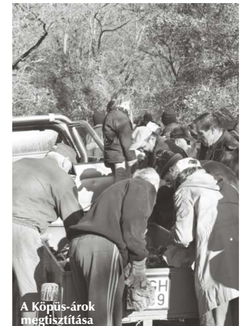
A Köpüs-árok megtisztítása

Ezúton mondok köszönetet Sukoró Önkormányzatának az Egyesületünknek nyújtott működési támogatásért. Köszönetet mon-