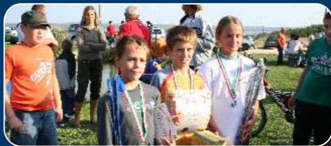
A gyermek horgászverseny győztesei