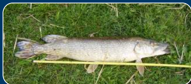
Kistóban nagy csuka, 74 cm!