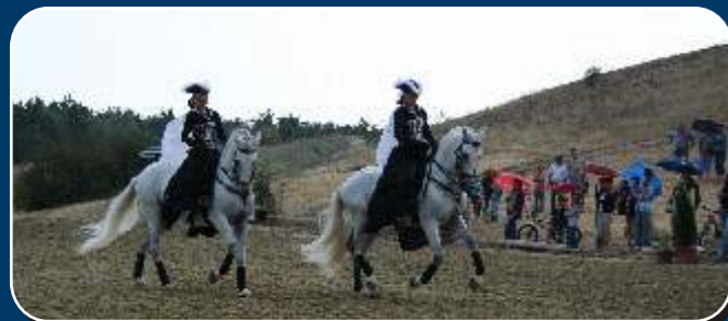
Velencei-tavi Nyári Játékok - Borsó Testvérek