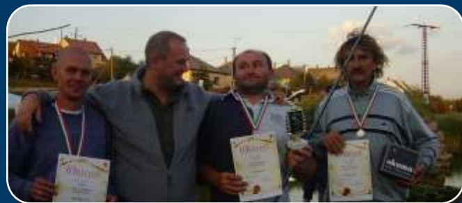
A felnőtt horgászverseny győztesei