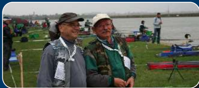
Horgászvilágbajnokság - A zsűri nemzetközi tagjai is jól érezték magukat