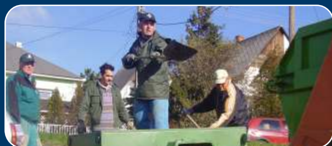
Az önkéntesek munkában