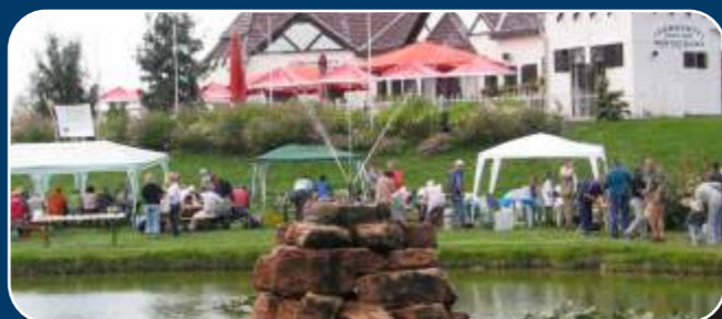
Falunap és halászléfőző verseny