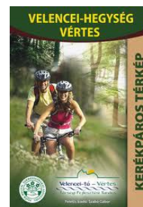
9. ábra Sikeres térkép