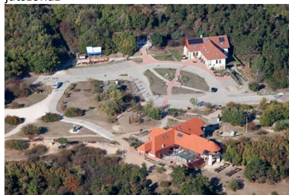
10. ábra KEMPP, Pákozd (Járt már ott ?)

2012.március 14. Márciusi Ifjak KEMPP, Pákozd (Katonai Emlékpark) Hagyományörző huszárok, élő történelemóra, játszóház