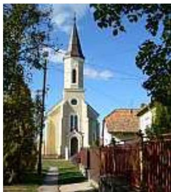
Református templom a kertjében '56-os kopjafával , A Váradai Biblia ,