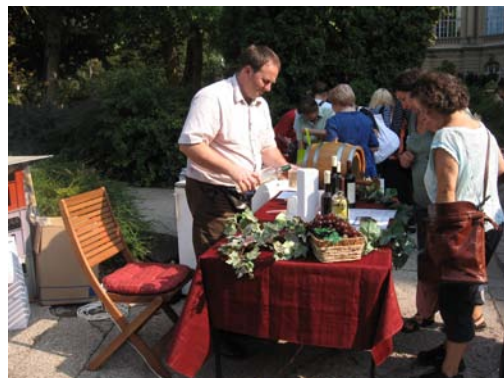
7. ábra Magyar Vidék Napja

Telefonszám: 06-22-470-212, www.velenceitoleader.eu