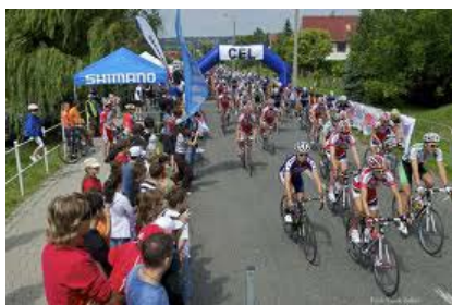
8. ábra Velencei-tó Kerékpár-túra

Tajvantól, Pompeijen át Torontóig és Horvátországig mindenki a biciklis turisták kegyeit keresi.