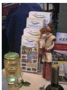
6. ábra OMÉK 2011

Az Utazás kiállítás remek alkalom a Velencei-tó népszerűsítésére, emellett a KDRMI szervezésének köszönhetően a PORT.hu Bringaexpo kiállításán párhuzamosan bemutatkozik a Velencei-tó.