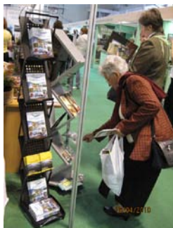
5. ábra LEADER EXPO