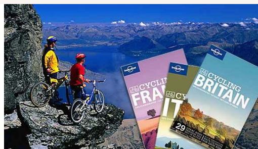
Eddig vadászni kellett a biciklis útikönyveket az eBay-en

A kerékpározás Európában, - és lassan idehaza is- elmozdul a magas minőségű turizmus irányába.