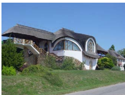
1. ábra Tekergő étterem, Velence

Utazás Kiállítás 2012 március 1-4. között