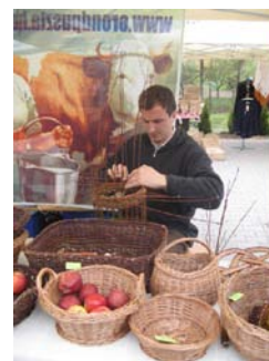
3. ábra Magyarok Vására, Velence

A Velencei-tó Térségfejlesztő Egyesület közösen a Helyi Erőforrás Kft.-vel és a VEKI-vel az Utazás 2012 kiállításon kiállítási blokkal segíti a helyi termelők piacrajutását. A Közép-dunántúli színvonalas kiállítási standon, a Velencei-tó 60nm 2 -en mutatkozik be a két TDM összefogásával.