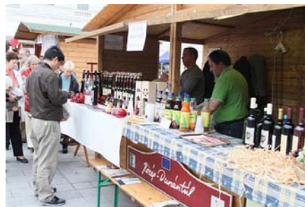
2. ábra Teret a Vidéknek, Pécs

Gárdony-Kápolnásnyék-Nadap-Pákozdi-Pázmánd-Sukoró-Velence-Vereb-Zichyújfalu