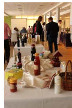
4. ábra Helyi termék bemutató Sajtónap

A Velencei-tó Térségfejlesztő Egyesület a LEADER program keretében a megelőző években is minden országos jelentőségű utazási kiállításon népszerűsítette a helyi szolgáltatókat, helyi termelőket. 2011-ben bevezette a „ VELENCEI-TÓ HELYI TERMÉK, HELYI SZOLGÁLTATÁS, HELYI ÉRTÉK EGYÜTTMŰKÖDÉST , amelyhez már több mint 40 szolgáltató csatlakozott a Velencei-tónál.